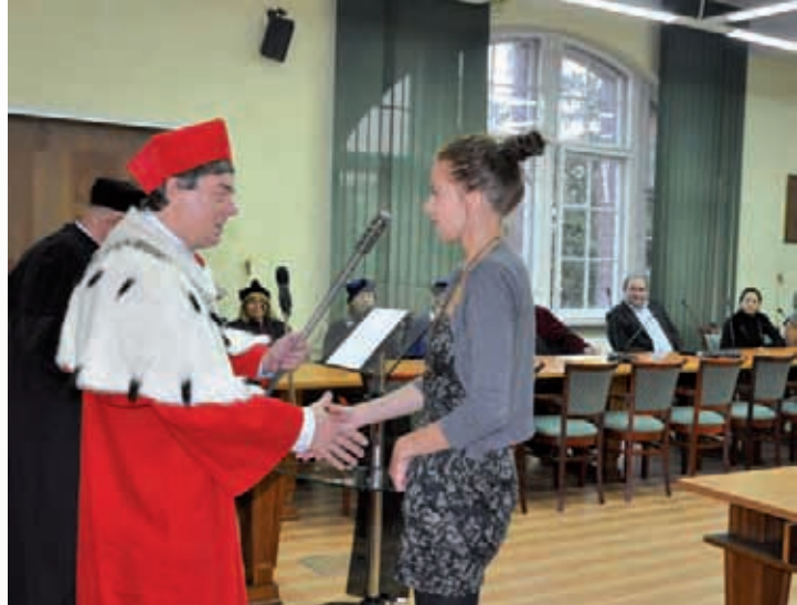
Pasowanie na studenta