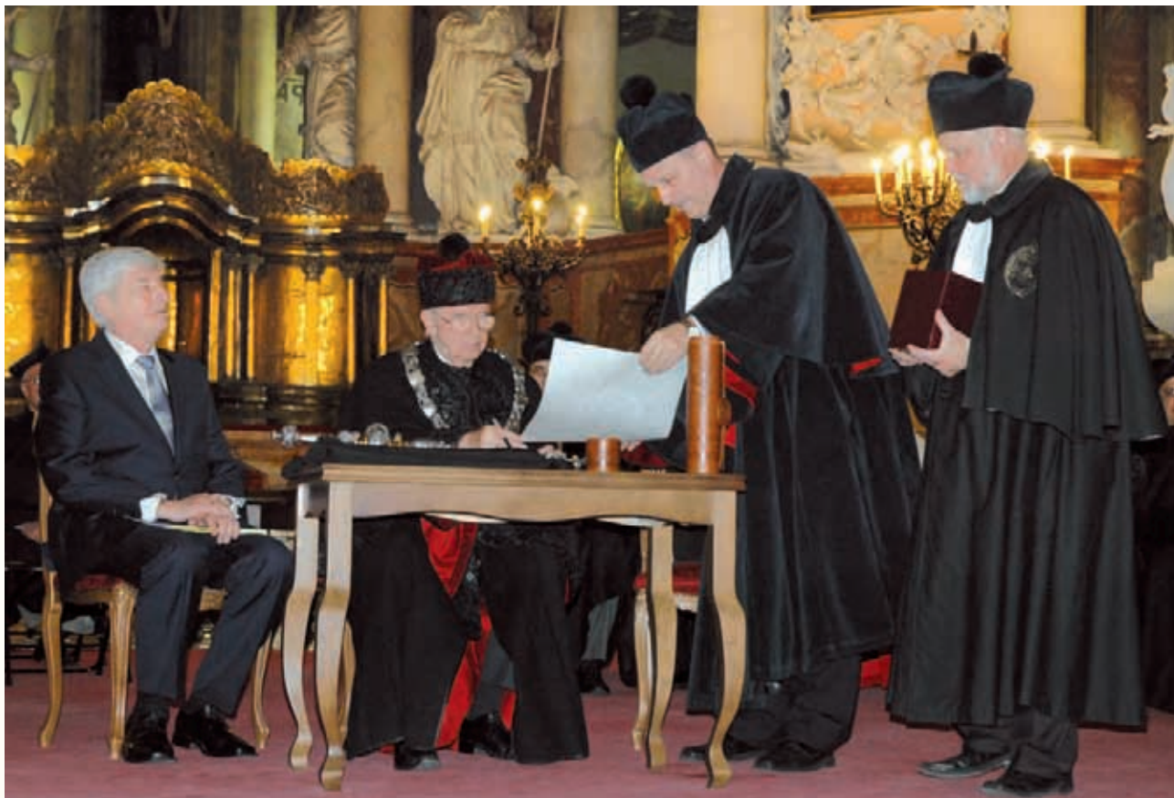
Ceremonia uwierzytelnienia dyplomu doktora honoris causa pieczęcią Uniwersytetu w Wilnie.