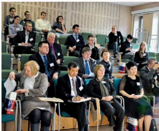
Goście konferencji Azja – Pacyfik

ryczną na spotkaniach, ale także wzięli na siebie trud redagowania roczników dokumentujących działalność seminarium. Kolegium Rektorów Uczelni Wrocławia, Opola, Częstochowy i Zielonej Góry na posiedzeniu w dniu 17 czerwca 2011 r. ustanowiło Nagrodę za szczególne działania w środowisku studenckim, w tym w szczególności za działalność naukową, kulturalną, artystyczną, sportową, dobroczynną lub inną społecznie użyteczną. Decyzją Kolegium Rektorów z dnia 2 listopada 2011 r. Laureatem Nagrody KRUCOZ w 2011 r. za szczególne działania w środowisku studenckim jest Centralny Ośrodek Duszpasterstwa Akademickiego „Maciejówka”. Laudację wygłosił JM Ksiądz-Rektor prof. Waldemar Irek. Podczas posiedzenia Kolegium odbyła się także uroczystość wręczenia dyplomów przyznanych, w ramach Studenckiego Programu Stypendialnego Prezydenta Wrocławia, doktorantom uczelni publicznych i niepublicznych oraz placówek naukowych, wyróżniającym się szczególnymi osiągnięciami w swoim obszarze wiedzy. Formuła Programu Stypendialnego została w części dotyczącej studentów studiów III stopnia zmieniona.