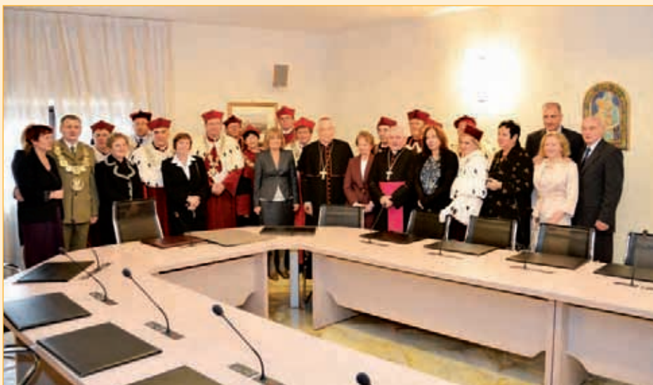
Spotkanie z kardynałem Zenonem Grocholewskim, Prefektem Kongregacji Edukacji Katolickiej

(Zdjęcia z uroczystości w Watykanie zamieściliśmy także na okładce pisma).