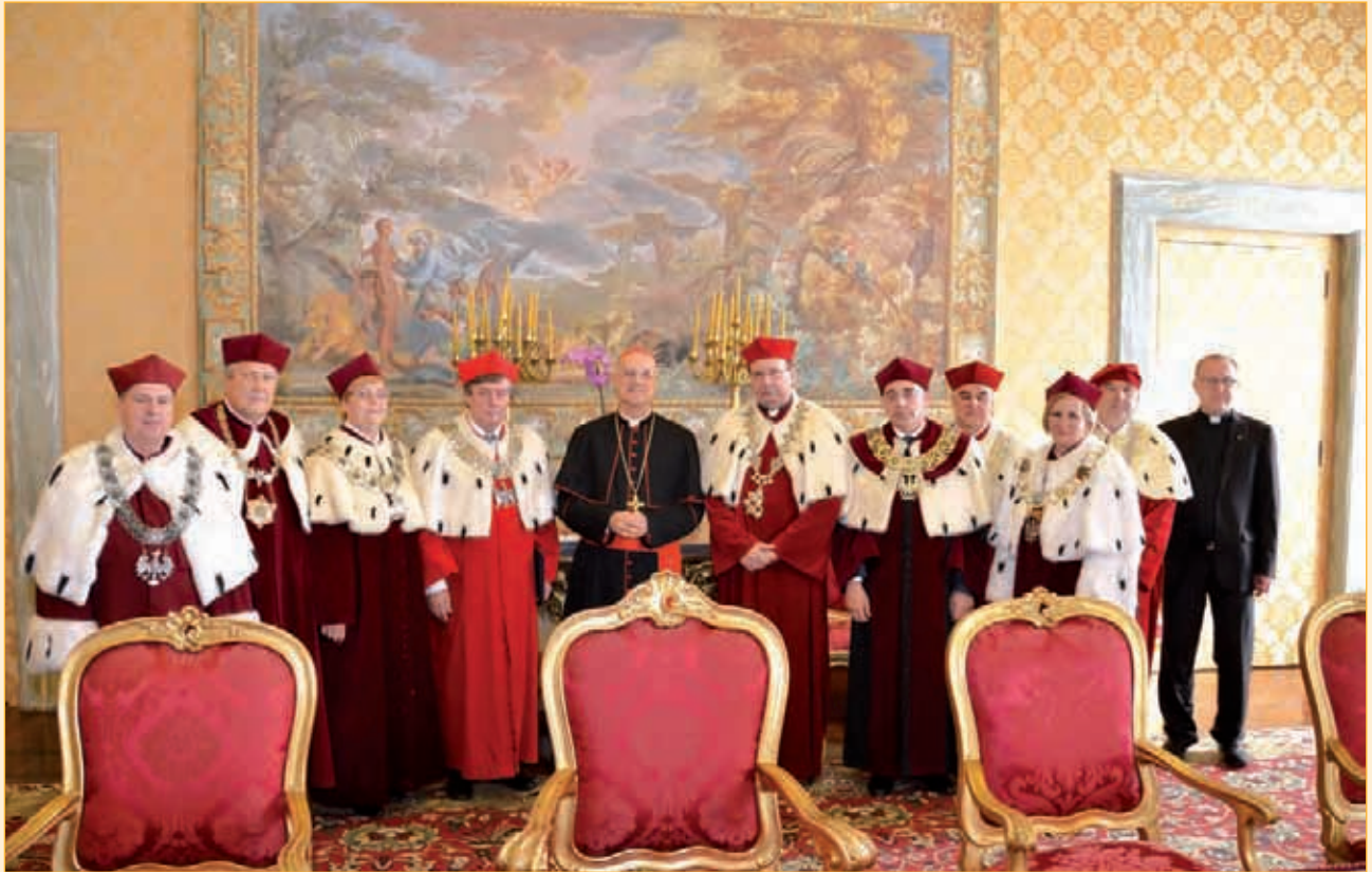
Rektorzy zrzeszeni w KRUWOCZ na audiencji u Kardynała Tarcisio Bertone, Sekretarza Stanu Stolicy Apostolskiej