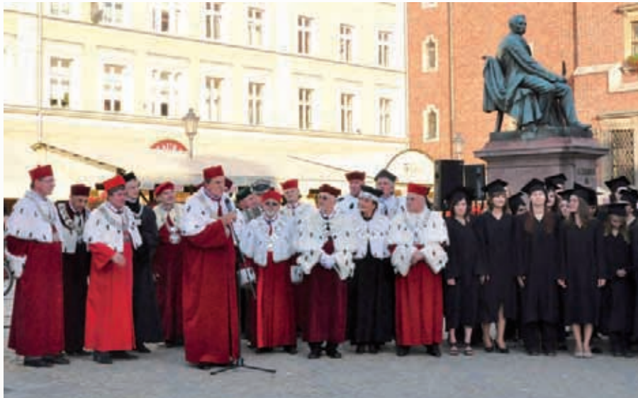
Ogólnopolska inauguracja roku akademickiego na wrocławskim Rynku (3 października)

uczestniczył w uroczystej Gali VIII edycji Konkursu „Dolnośląski Gryf – Nagroda Gospodarcza”.