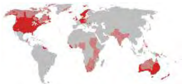
Mapka: Język niemiecki na świecie

na całym świecie 2 , np. w Stanach Zjednoczonych, Brazylii, Kanadzie, Francji, Argentynie, Rosji, w Kazachstanie, Australii, Holandii, Wielkiej Brytanii, Hiszpanii, Chile, Paragwaju, na Węgrzech, w Republice Południowej Afryki, Meksyku, Izraelu, Rumunii i w Czechach 3 .